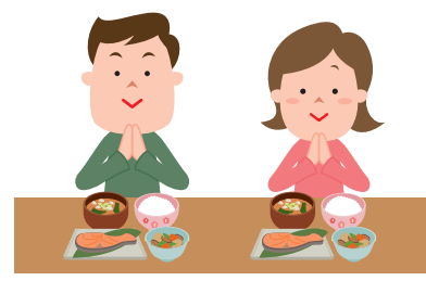
食事の際は横並びで。