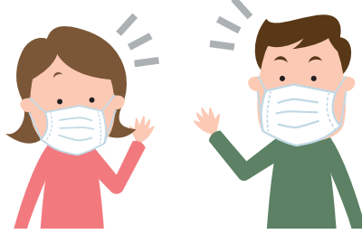
会話をする際は真正面を避ける。