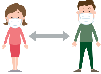
人との間隔を空ける。