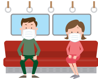
公共交通機関での会話は控えめに。混雑する時間帯は避ける。