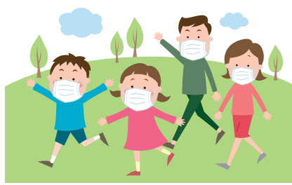
遊びに行くなら屋内より屋外へ。