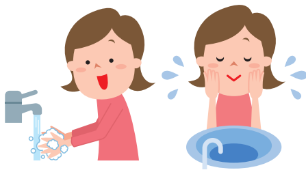
帰宅後すぐに手や顔を洗う。