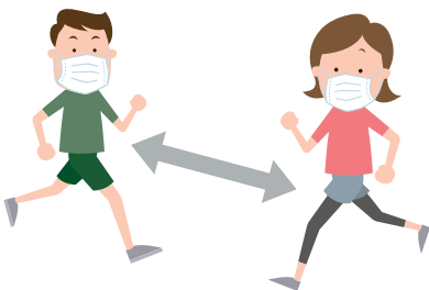
ジョギングは少人数で。すれ違う時は距離をとる。