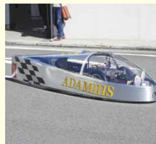
優勝した燃料電池車