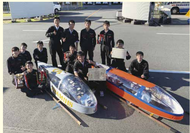
島工自動車部のみなさん