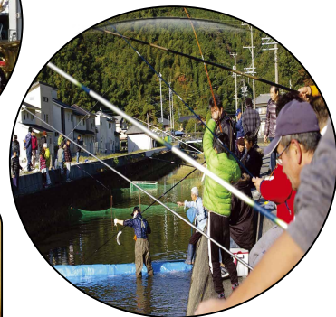
11月 親子マス釣り大会