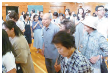
元気をもらい、再開の誓いを胸に解散する参加者