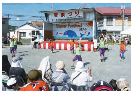
暑さに負けず踊りまくる元気なダンサー