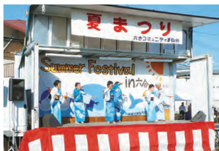
若々しく舞踊で盛り上げる演技者ら