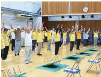
入念な準備体操で大会に備える参加者