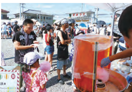
暑さに負けず挑戦した「綿菓子作り」