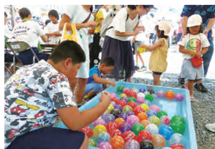
なかなか難しかった！「ヨーヨー釣り」