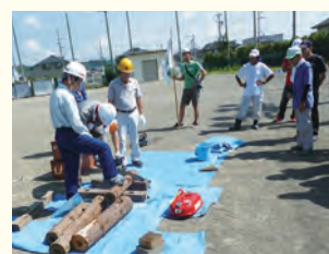
チェーンソーによる木材切出しの訓練風景

当日は午前九時の防災訓練地震発生サイレンを合図に各学校に集合しその後、応急救護訓練(応急担架・三角巾)・可搬ポンプ操作訓練・発電機操作訓練・初期消火訓練・濾水機操作訓練・給食給水訓練等を、各ブースに分かれて実地訓練を受けました。多くの中高生も参加し地域防災の重要性を体験でき、有意義な時間を過ごせたと思います。 災害は起ころないに越したことはありませんが、いつか必ず起こるものです。最近では地震ばかりではなく異常気象による暴風水害も多発しております。いつ、どこで、何が起こっても対応できるように訓練・意識して生活していく事が大変重要になります。訓練を通して自分たちの身の周りの防災について考えていきたいと思います。