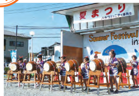
和太鼓を息ピッタリで演技する太鼓隊