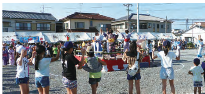
新たに「東京五輪音頭 -2020-」を加えて楽しんだ盆踊りタイム