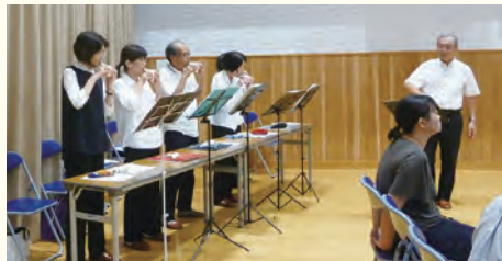
来賓、遺族の方々に続き一般参列者の献花を促すオカリナの演奏