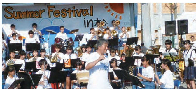
アンコール・・・に応じて熱演する吹奏楽部員