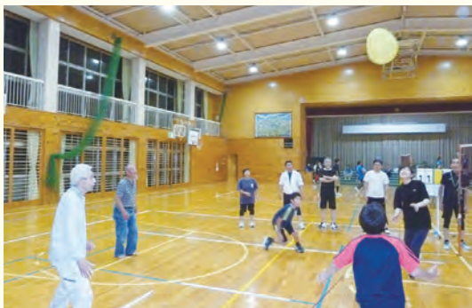
ボールが変な方向に飛んで行く、跳ねる、もう大変なことに…

また、ボールの飛ぶ方向に意外性があり、予測を付けにくいことがゲームを面白くしています。参加者は「ノーパンだよ」とかワンパン、ワンパンと声をかけサポートし合う雰囲気も楽しかった。「バレーボールよりボールが落ちてくるのが遅いのでスパイクも難しい。」また、「ルールも簡単、若者から高齢者までできますね。」と感想を語ってくれました。十二月には市の大会があります。楽しく動いて、爽やかな汗をかきませんか。