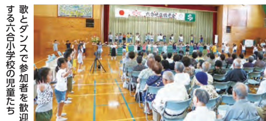
歌とダンスで参加者を歓迎する六合小学校の児童たち