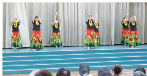
ハワイアンムード 一色に包まれたフラ演技