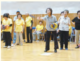
真剣に的を目標けてナイス スロー