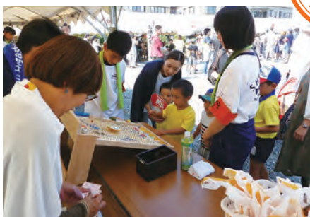
「子供お楽しみクジ」と売売した「ポップコーン」