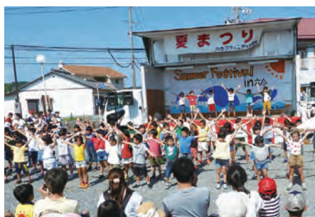
歌とダンスを披露する児童たち