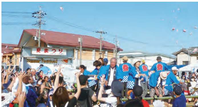
高く舞上がった餅をナイスキャッチする参加者ら

八月四日(日)十四時から六合公民館駐車場及び多目的ホールにて、令和になって初めての六合夏まつりが開催されました。例年厳しい暑さのなか開催されますので、今年も楽しく安全に夏まつりに参加して頂けるよう熱中症対策に重点を置き進めて参りました。 当日は天候にも恵まれ、園児からお年寄りの方々まで多くの地域住民の皆様のご来場を頂き、各売店やバザーで買い物を楽しんだり、アトラクションや餅投げや盆踊りに参加され会場中が笑顔で溢れておりました。