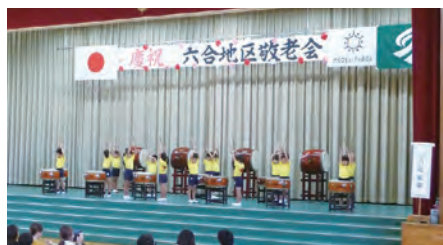
和太鼓を元気いっぱい演奏する六合幼稚園の園児たち

元気あふれるアトラクションで楽しいひと時を過ごし、「心の若さ」を保つ事ができました