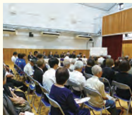
来賓の方々の「追悼のことば」に耳を傾ける参列者ら