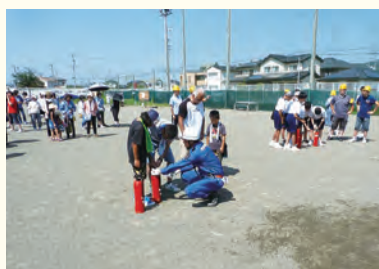
熱心に消火器の操作体験をする参加住民

八月二十五日(日)に道悦島地区で総合防災訓練が実施されました。道悦一・二・三丁目と高島町の住民六六二名は六合中学校で、道悦四・五丁目と住民五九三名は六合小学校でそれぞれ訓練を受けました。