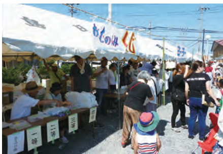
一等賞に期待する「三角くじ引き」