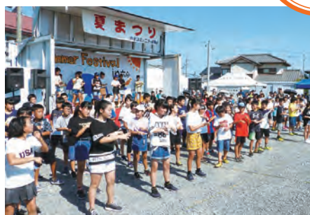
みなで元気にダンスを披露する児童ら