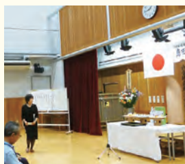
「追悼のことば」を捧げようとする 島田市静玉奉賛会会長(梁谷市長)