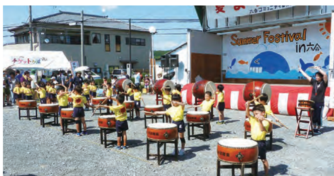
元気良く和太鼓をたたく園児らの演技