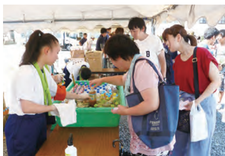
暑さで売れ行き好調な「清涼飲料水」