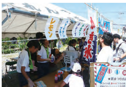
売れ行き絶好調の「かき氷」