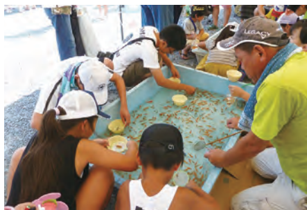
果敢に挑戦する「金魚すくい」