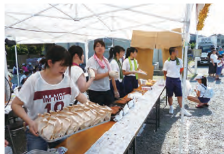
準備できた～「フライドポテト、フランクフルト」