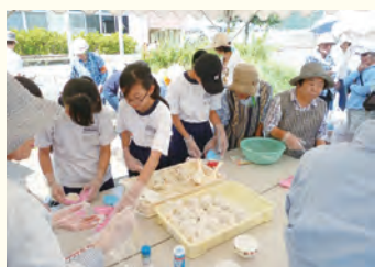
非常食の配布訓練をする参加者