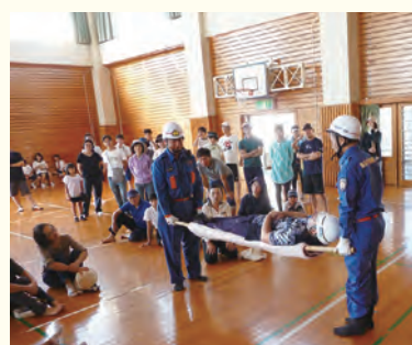
担架搬送の訓練に参加した町民