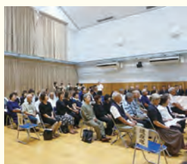
戦没者追悼式に参列の多くの遺族の方々及び一般参列者