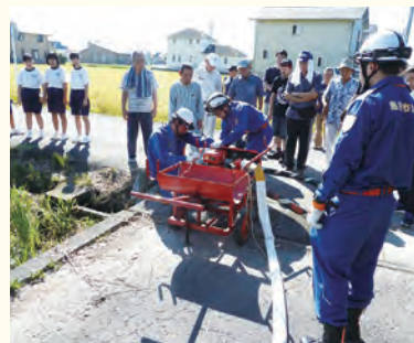
初期消火用可搬ポンプの操作手順を確認