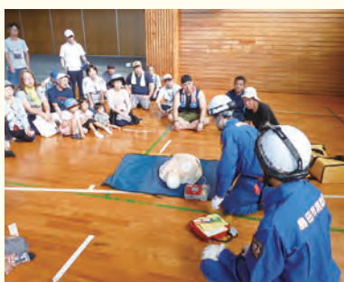
AED 操作の訓練を受ける参加者たち

九月一日(日)総合防災訓練が実施されました。七時半に組長の指示により、各地区の集合場所に集合し六合東小学校に集合し訓練が実施されました。一六七八名の住民が集まり防災委員長の挨拶の後、初期消火訓練・消火器操作訓練・濾水機使用訓練・AED使用による救護訓練・簡易トイレ設置訓練・避難所運営訓練・非常食の配布等の訓練を各ブースに分かれ体験しました。中高生は簡易トイレの設置訓練を中心に体験し貴重な経験ができたと思います。