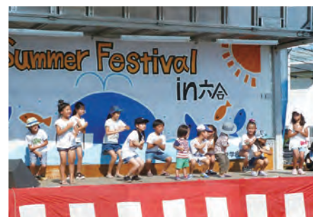
ステージを所狭ましと元気に踊る出演者たち