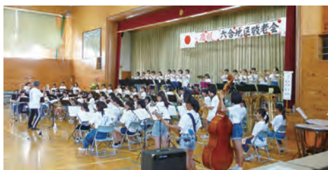
見事な演奏でフィナーレを飾った六合中学校の吹奏楽部