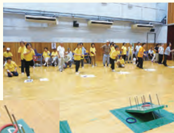
楽しく競い合う選手たち