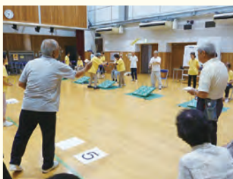
高得点目指して・・・エイッ!