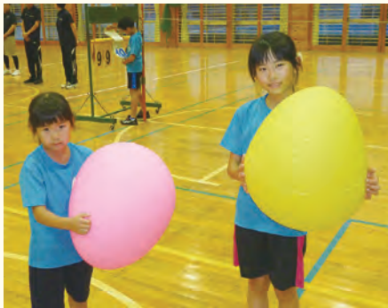
私たちの顔よりも、こんなに大きいよ!

六合小学校体育館で「ワンバウンドふらば〜るバレーボール講習会」が行われました。市スポーツ推進委員の方の指導により、参加者は4つのチームに分かれ、コート上でネット越しに変形ボール(ふらば〜る)を打ち合いました。軽い変形ボールを使用するため、スピードが遅く突き指の心配がないので、ボールに恐怖心を持つことはありません。ネットは低いので、相手コートに返すのは比較的簡単。問題はバウンドした後のボールの行方! なにせボールが真円じゃないもので、バウンドしたら右に行ったり左に行ったり。