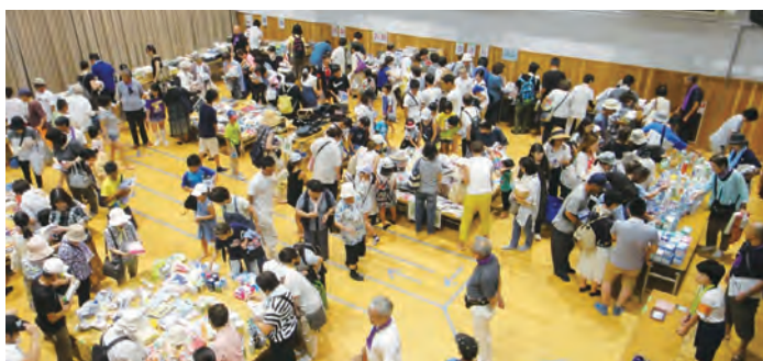
大盛況でにぎわうバザー会場