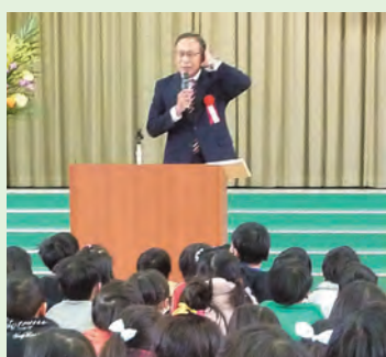
六合東小学校校長先生