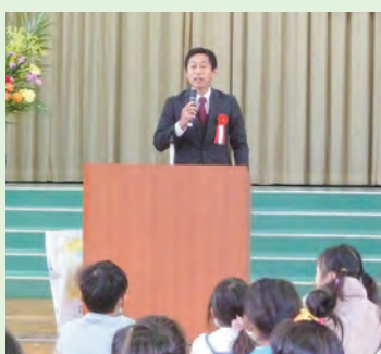
六合小学校校長先生

二月二十五日(日)、六合小学校にて「入学祝いの会」が開催されました。四月から小学校に入学される皆様おめでとうございます。 生まれた時は家族の中心だったお子さんも大きくなり、幼稚園・保育園を卒園し、この「入学祝いの会」を通して地域とまたひとつ大きな関係が築かれました。 小学校入学時は、まだ幼さが残る子も多いですが、卒業する頃にはみなたくましくなり、また友達にかこまれて大きく成長しているでしょう。元気に楽しい学校生活を送ってくださいね。